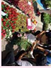
土と苗サービスデー