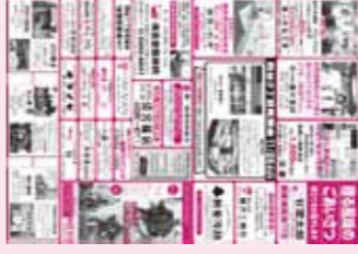
四谷2丁目発表会チラシ